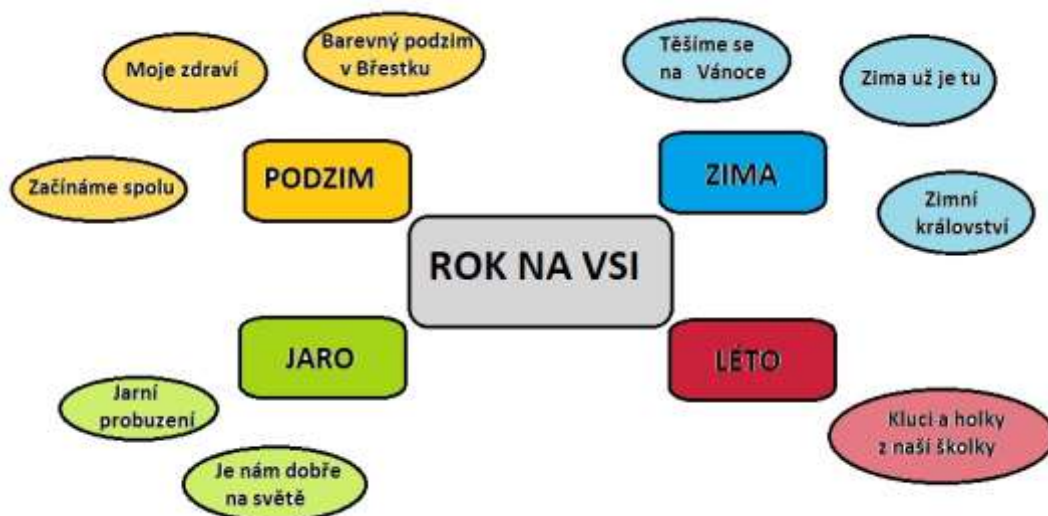
obr. 2.: Schéma tematických celků

Integrované bloky jsou časově plánovány na delší časový úsek, proto si je dále dělíme na menší složky – „tematické celky“ (zkr. TC). Tyto celky si učitelky zpracovávají konkrétně a podrobně ve svých třídních vzdělávacích programech dle pěti vzdělávacích oblastí.